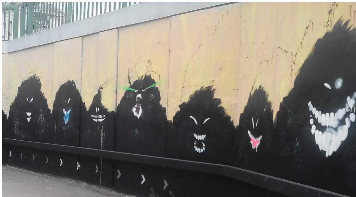
Streetart v Karlových Varech, Vlastní foto, 2015