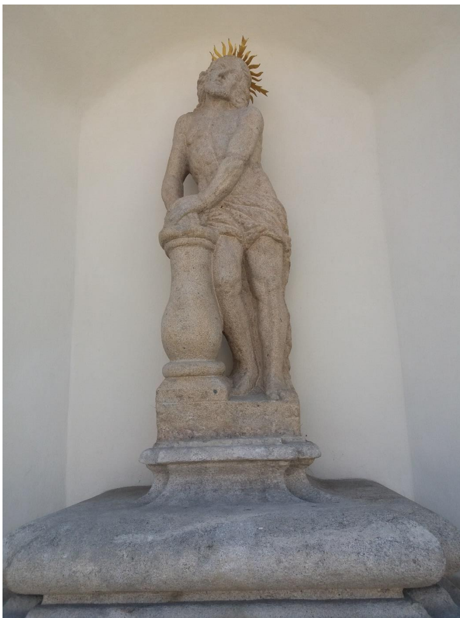
Sochařství, Vlastní foto, 2016