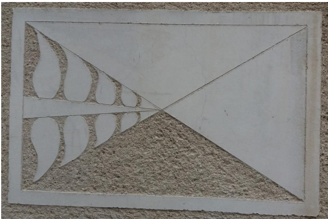
Sgraffito, Vlastní foto, 2016