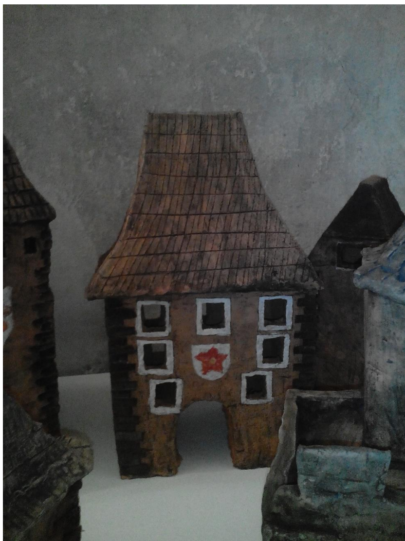
Keramika, Vlastní foto, 2014