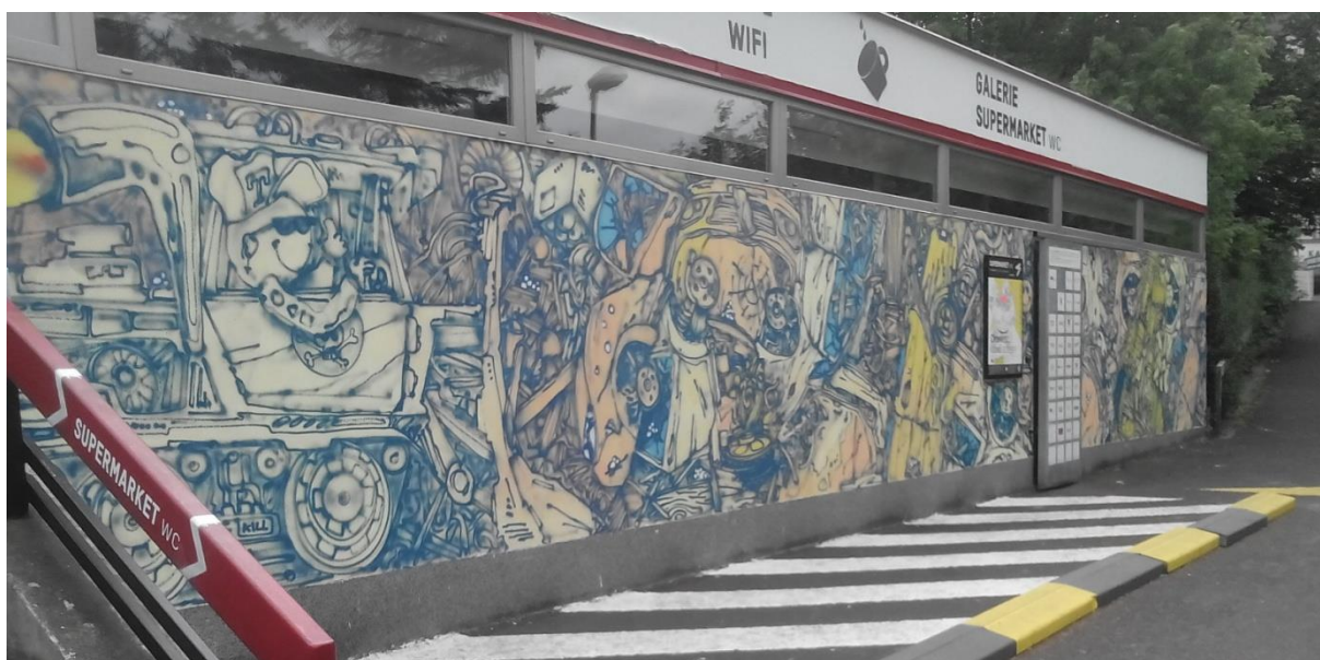
Graffiti, Vlastní foto, 2015