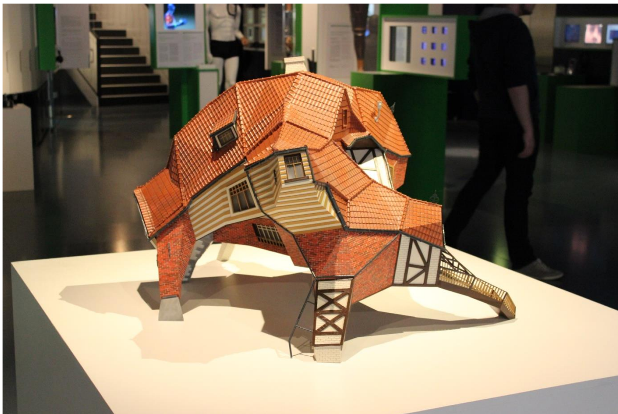
Architektura, Foto: Klára Mášová, použito se svolením autora, 2015