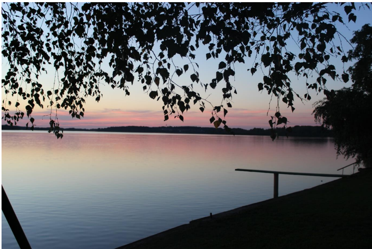
Fotografie, Foto: Klára Mášová, použito se svolením autora, 2015