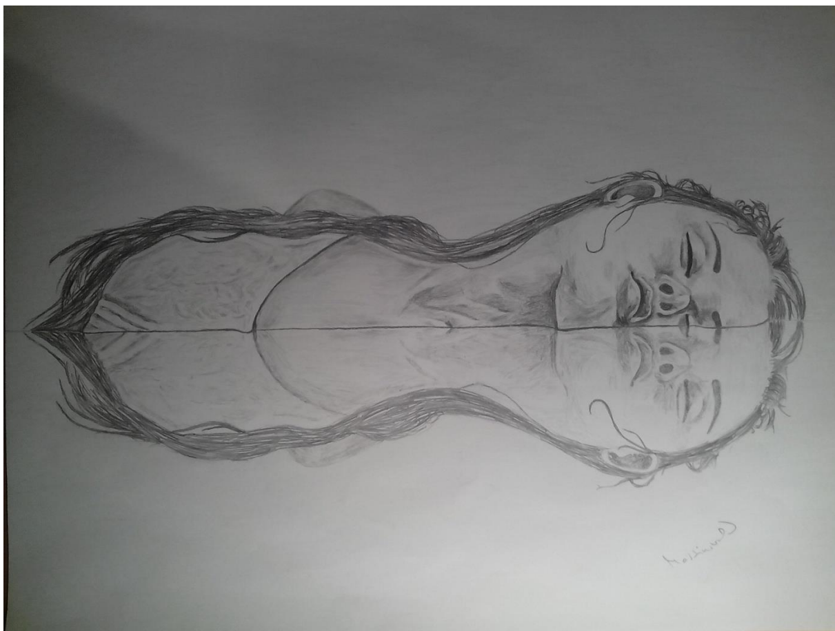
Odraz v hladině, Kresba Martinovská Tereza, 2015