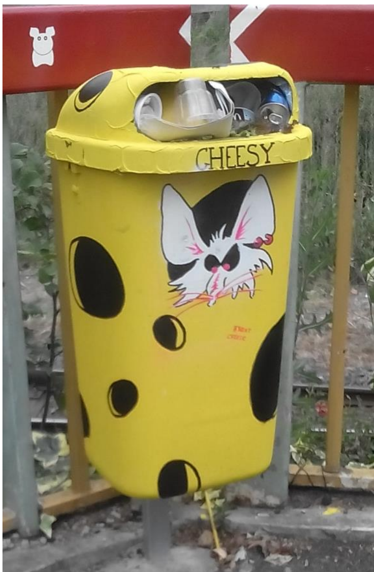
Streetart v Karlových Varech, 2015