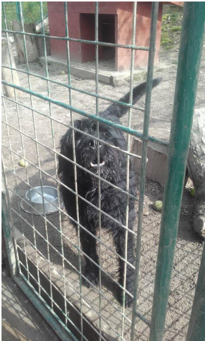
Knírač Felix, 2016