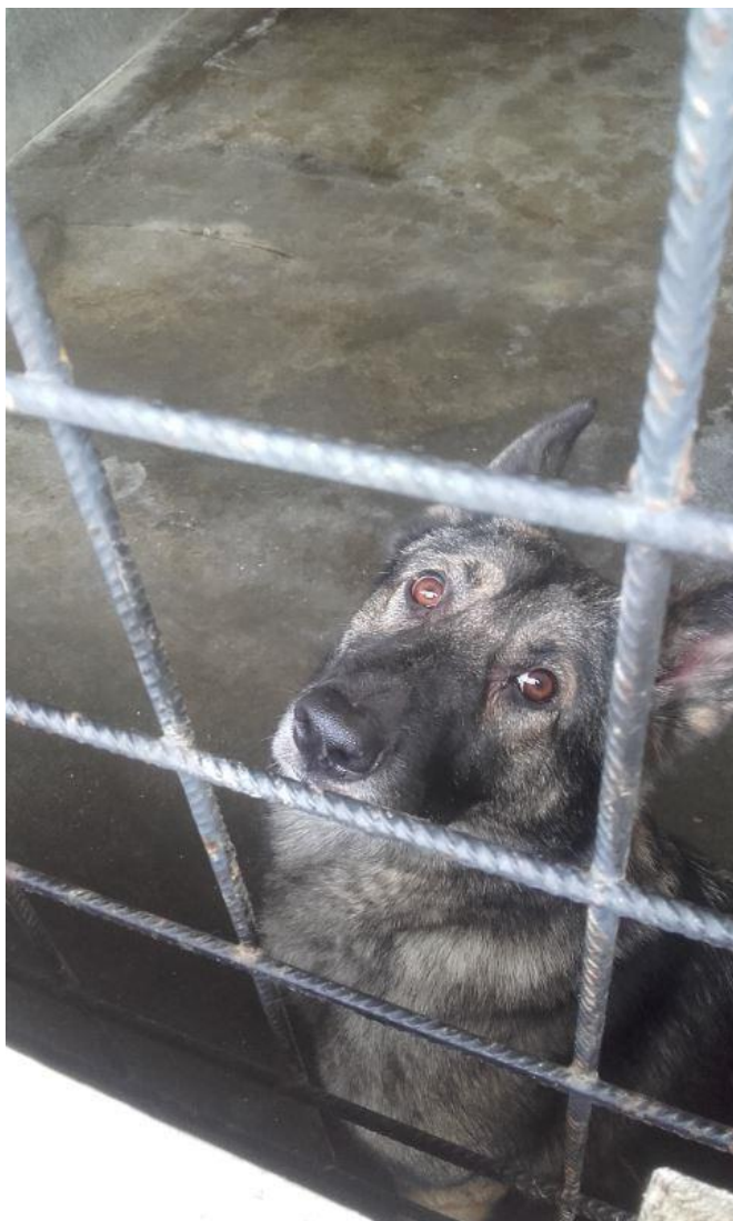
Ovčák Uni, 2016