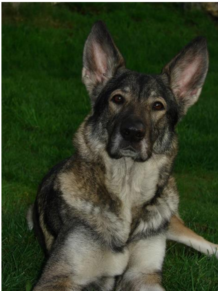
Elba 2, foto vlastní, 2015