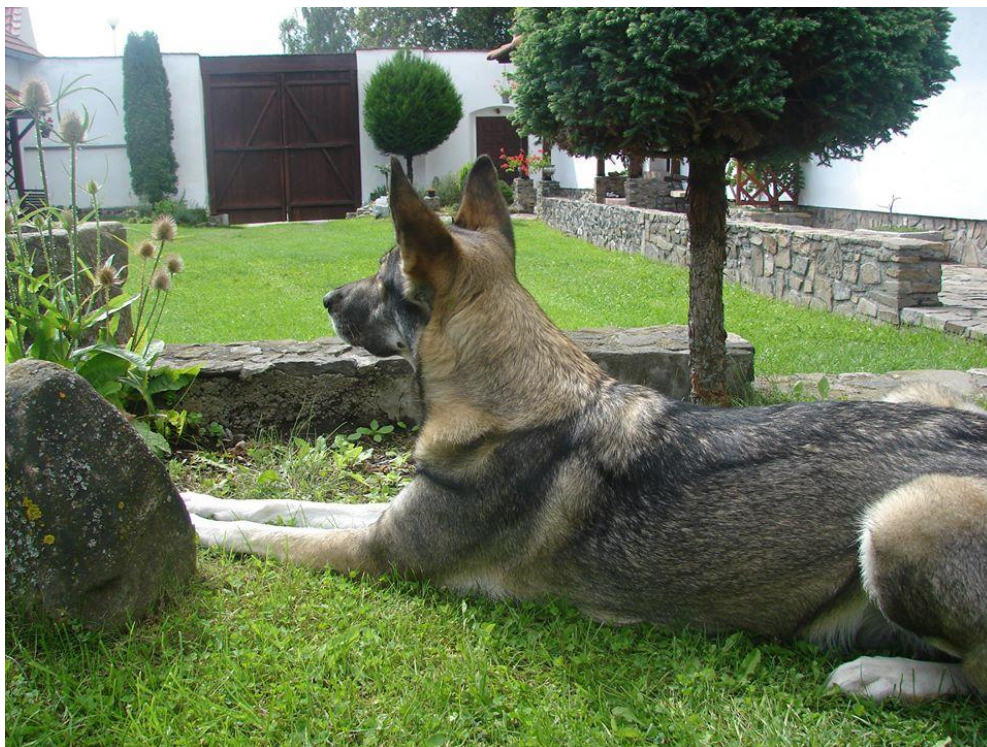
Elba 4, 2015