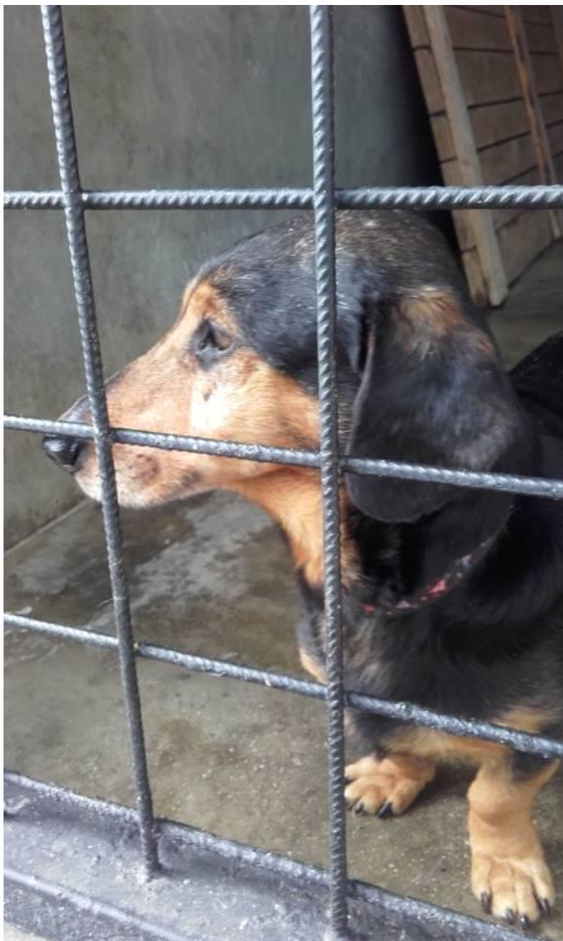
Jezevčík Max, 2016